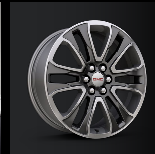
RINES DE 20"