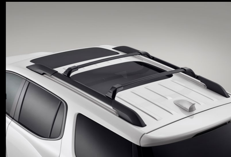
BARRAS DE TECHO TRANSVERSALES