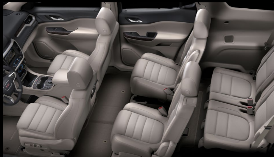
ESPACIO INTERIOR PARA 6 PASAJEROS (2-2-2)