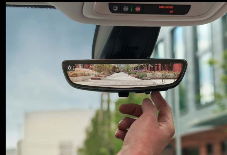
ESPEJO RETROVISOR CON FULL MIRROR DISPLAY