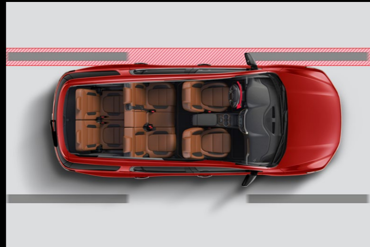
ASISTENTE DE MANTENIMIENTO DE CARRIL