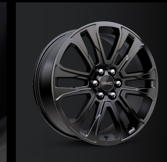
RINES DE 20"