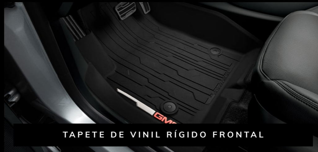
TAPETE DE VINIL RÍGIDO FRONTAL