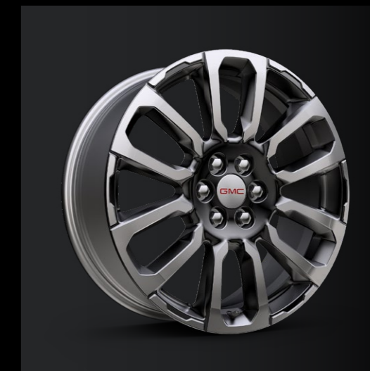
RINES DE 20"