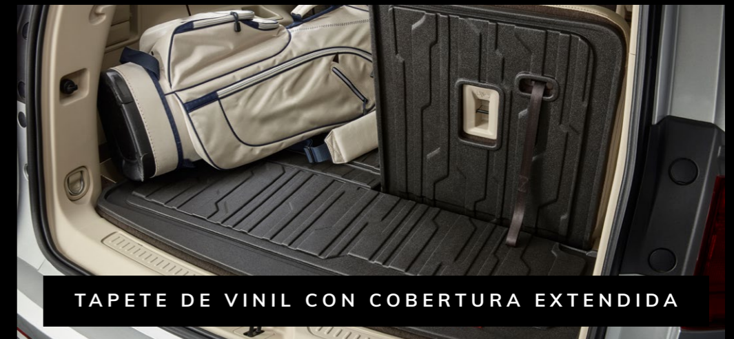
TAPETE DE VINIL CON COBERTURA EXTENDIDA