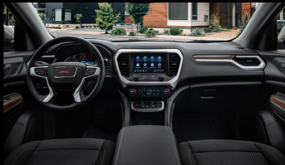
INTERIOR FORRADO EN PIEL CON ASIENTOS EN TELA DE ALTA CALIDAD