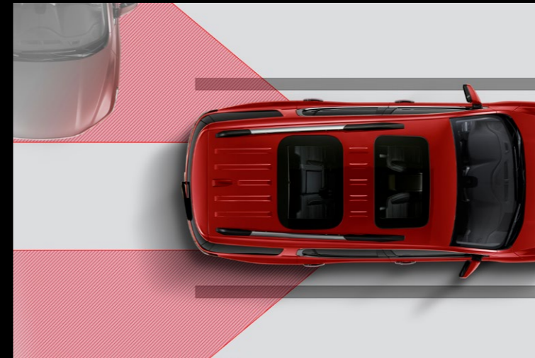
ALERTA DE TRÁFICO CRUZADO TRASERO