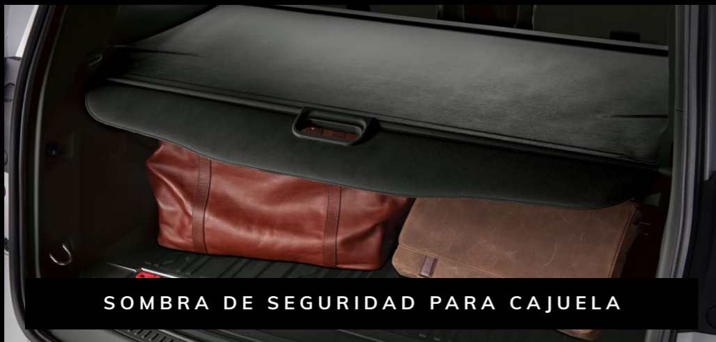
SOMBRA DE SEGURIDAD PARA CAJUELA