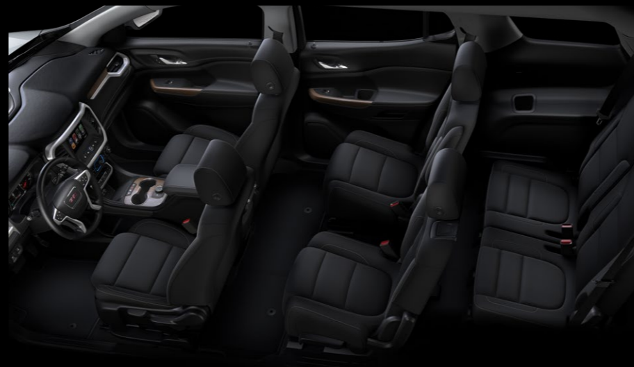
ESPACIO INTERIOR PARA 6 PASAJEROS (2-2-2)