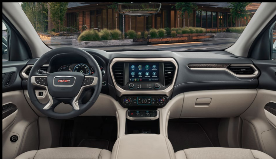
ASIENTOS FORRADOS EN PIEL