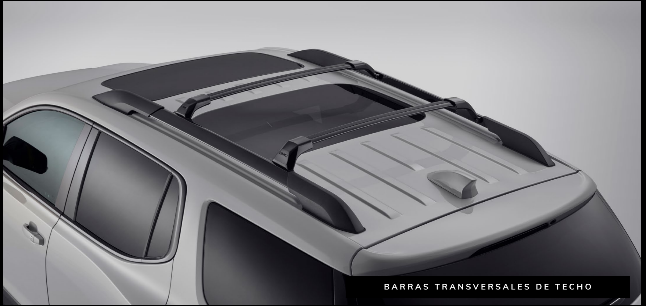
BARRAS TRANSVERSALES DE TECHO