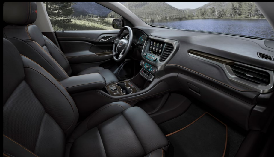
ASIENTOS FORRADOS EN PIEL