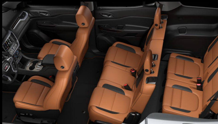
ESPACIO INTERIOR PARA 7 PASAJEROS (2-3-2)