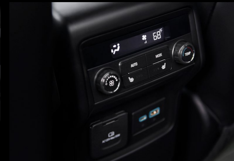
AIRE ACONDICIONADO INDEPENDIENTE PARA TERCERA FILA