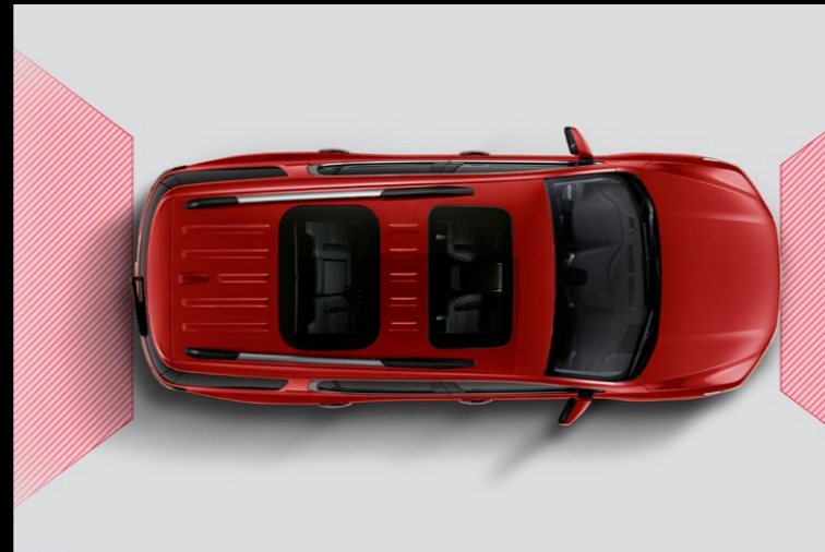
SENORES FRONTALES Y TRASEROS PARA ESTACIONADO